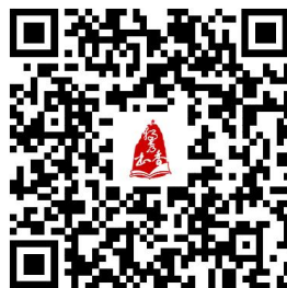
微视频《图书馆宣传片》