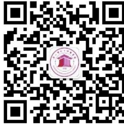
图书馆微信公众号

(2) 手机用户请关注“广西师范大学图书馆”微信公众号，在“服务”栏中点击“入馆教育”登入。